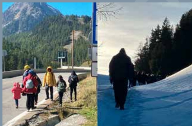
Sono gli scatti di copertina del Rapporto di On Borders, “La frontiera alpina del NordOvest”.

In alcuni mesi del 2025 questi ragazzi hanno costituito un terzo di tutti gli arrivi al rifugio e comunque un quarto nell'arco di tutto l'anno. « Non tutti i minori sono riconosciuti tali allo sbarco , per cui per alcuni è ancora una volta necessario mettere a repentaglio la propria incolumità nell'attraversamento del confine montano. Non essere segnalati fin dal primo ingresso in Europa come minorenni è correggibile, però i ricorsi comportano tempi e prassi molto lunghe. L'accertamento non è semplice e poi, in ogni caso, ri-